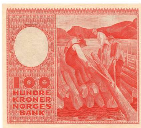
34 100 kroner 1950 B.1706833. Litt bølger i papiret. Kv.0/01