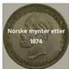
Norske mynter etter 1874