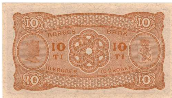
11 10 kroner 1942 B.2787965. Kv.0