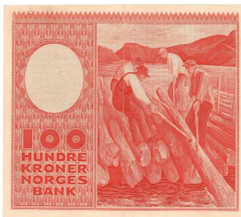
33 100 kroner 1949 A.3826392. Pen seddel. Kv.1+/01