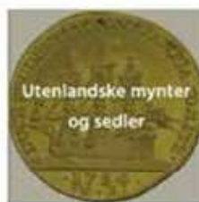
Utenlandske mynter og sedler