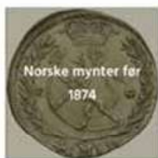
Norske mynter før 1874