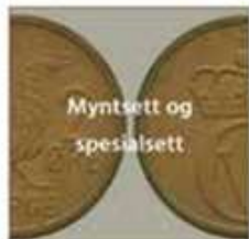
Myntsett og spesialsett