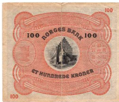
1 100 kroner 1943 C.1768137. liten rift i bredt øvre. Kv.1