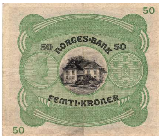
2 50 kroner 1939 B.7336620. Ex. Skanfil 204. Kv.1/1+