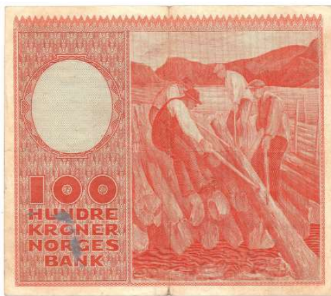
42 100 kroner 1957 Z.0274675. Erstatningsseddel. R-seddel. Ex. Meyer Eek nr.14/67. Tusj flekk revers. Kv.1/1+