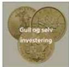
Gull og sølv investering