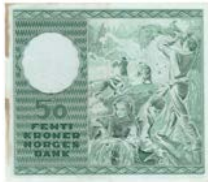
189 50 kroner 1963 Z.0220746 Erstatningsseddel. Farget marg revers. Svært sjelden. Kv.1/1+ Verdivurdering 12 000 - 14 000