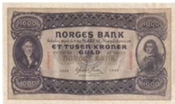
17 1000 kroner 1940 A.0593961. 3 rifter i bunnmarg. Sjelden. Kv.1 Verdivurdering 15 000