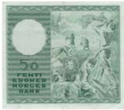
188 50 kroner 1960 Z. 0182140. Erstatningsseddel. NP.34.c Svært sjelden. Kv.1 Verdivurdering 20 000 - 22 000