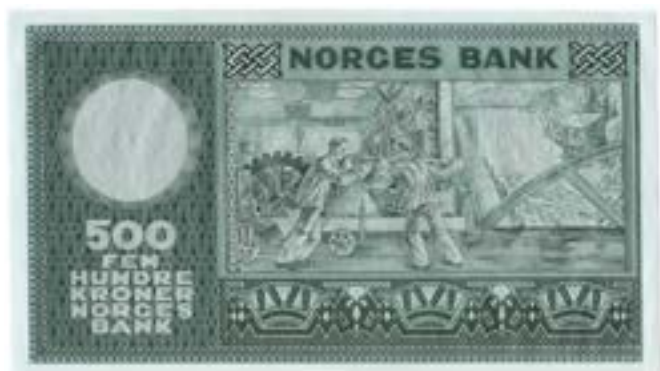
129 500 kroner 1958 A.1069491. Lite håndteringsmerke i øvre marg. Nydelig seddel. Kv.0 Verdivurdering 12 000 - 15 000