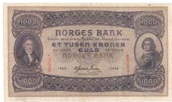
15 1000 kroner 1932 A.0413411. Ex. Skanfil 213. Sjelden. Kv.1/1+ Verdivurdering 25 000 - 28 000