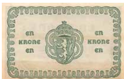
195 1 krone 1917 No.4778353. Kv.01