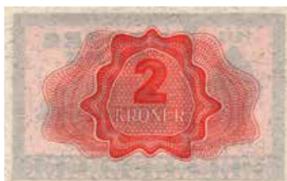
190 2 kroner 1943 C.5490980. Gradert til 66 EPQ hos PMG. Kv.0