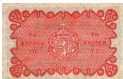
188 2 kroner 1922 No.2631392. Kv.0/01