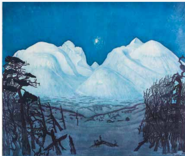
Harald Sohlberg «Vinternatt i Rondane» Fargelitografi signert og nummerert