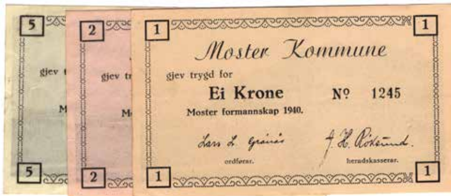
187 Nødseddel fra Moster kommune. 1, 2 og 5 kroner. N85-87. Kv.1+ til 0/01