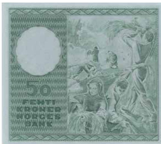
83 50 kroner 1965 F.0113178. Gradert til 65 EPQ hos PMG. Kv.0