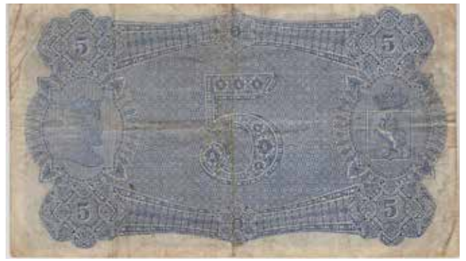
17 5 kroner 1899 D.6872877. Sign. Rhode. Gradert til 30 VF hos PMG. Kv.1-