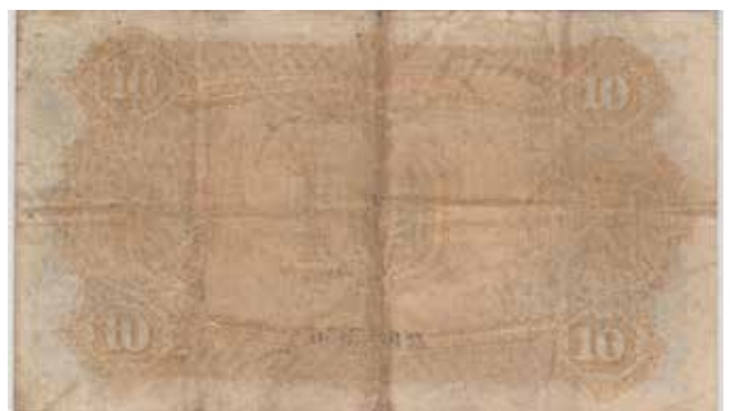
12 10 kroner 1897 B.8939763. RR-seddel. Sign. Oxholm. Gradert til 30 VF hos PMG. Pent eksemplar. Kv.1 55.000