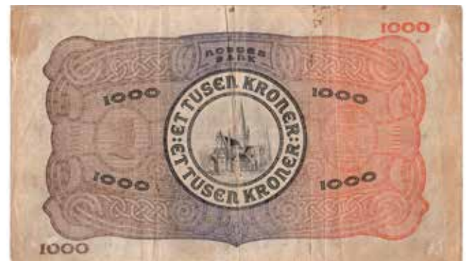
20* 1000 kroner 1920 A.0216749. SSS-seddel. Kv.1/1-