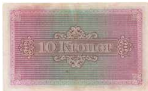
199 10 kroner 1940 Færøene. Nr.895970 C. Kv.1+