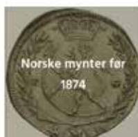
Norske mynter før 1874