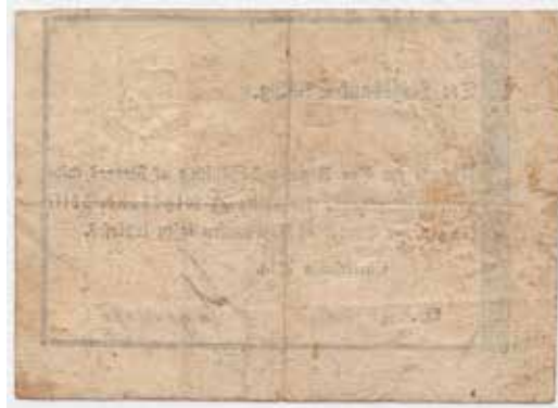
5 3 Rigsbankskilling 1814. No.72140. Udstedt av Norges midlertidig riksbank i 1815. NPA83. Kv.1 2.500