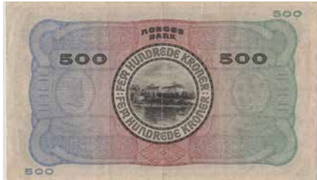
22 500 kroner 1941 A.0340180. Gradert til 35 VF hos PMG. SS-seddel. Kv.1/1+