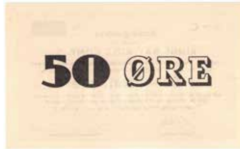
194 50 øre 1949/50 Kings Bay Kull Comp. Blankett serie C. RRR-seddel. KB1. Kv.0