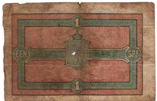
8 1 Speciedaler 1867 No.1502520. Hull i senter. Kv.1-/2 15.000