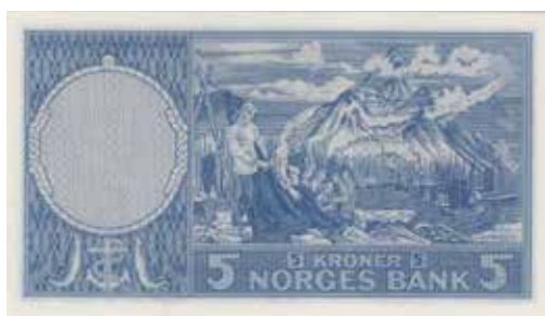
88 5 kroner 1961 1.9276485. Gradert til 67 EPQ hos PMG. Kv.0