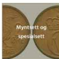
Myntsett og spesialsett