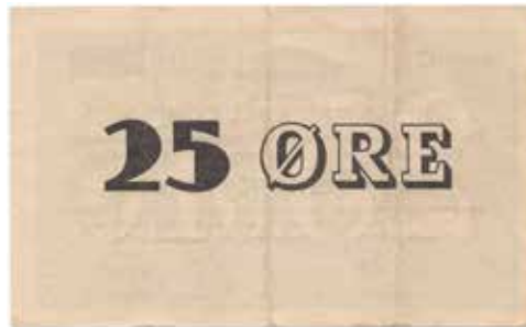
195 25 øre 1949/50 serie C. Kings Bay Kull Comp. Signert blankett. RR-seddel. 2 kjente eks. Kv.1