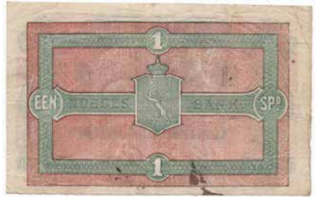
9 Speciedaler 1876 No.9260753. Flekk revers. Pen seddel med friske farger. NPA118. Kv.1/1+ 38.000