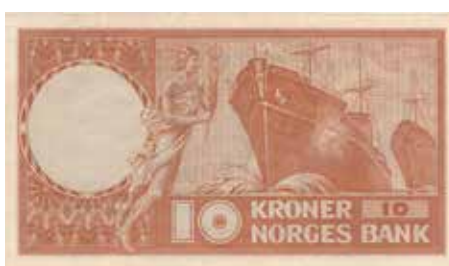
84 10 kroner 1955 E.5032395. Kv.0