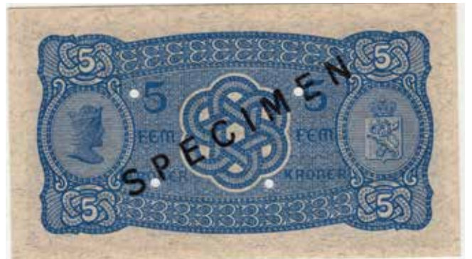
19 5 kroner 1944 W.3162679 Specimen. Gradert til 64 EPQ hos PMG. Kv.0