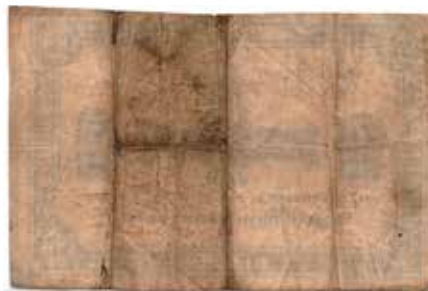
197 25 øre 1892 Grønland. No.43591. Gradert til 12 Fine hos PMG. Sjelden. Kv.1-/2