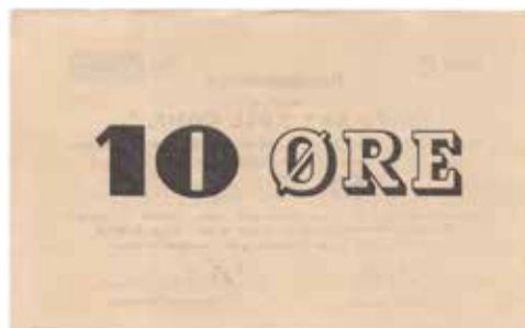
196 10 øre 1949/50 serie C. Kings Bay Kull Comp. Signert blankett. R-seddel. Ca. 5 kjente. Kv.1