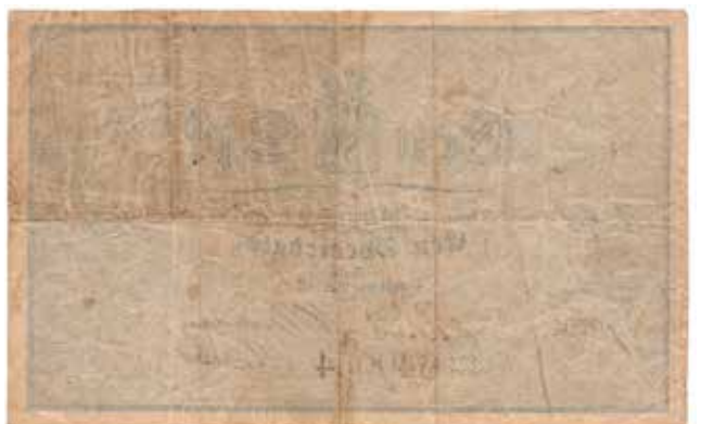
7 Speciedaler 1861 No.640054. Uvanlig pen til denne utgaven å være. Fine farger og ingen rifter. Sjelden seddel. NP.112B. Kv.1/1+ 60.000