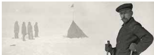
Tekst og bilder er hentet fra boken om Amundsen