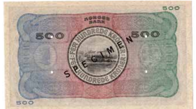
18* 500 kroner 1944 A.0524032. SPECIMEN. Nydelig seddel, vanskelig og undervurdert. Kat.62Cs. Kv.0