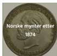
Norske mynter etter 1874