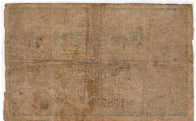
6 Speciedaler 1859 No.158751. Revne i senter på midtbrett. Sjelden seddel. NPA112b. Kv.1- 40.000