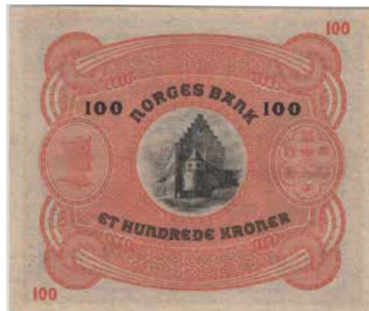
23 100 kroner 1934 B.0333757. Gradert til 45 EPQ hos PMG. Kv.1+