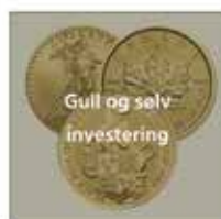
Gull og sølv investering