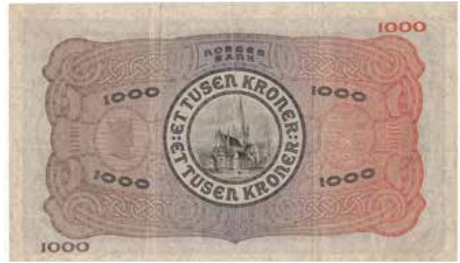
21 1000 kroner 1943 A.0874667. Pen seddel med fine hjørner. SS-seddel. Kv.1/1+