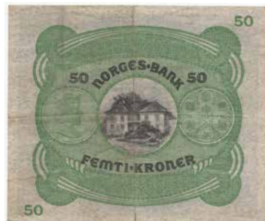
26 50 kroner 1927 A.9168257. små rifter i venstre marg. SSS seddel. Kv.1-