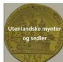
Utenlandske mynter og sedler