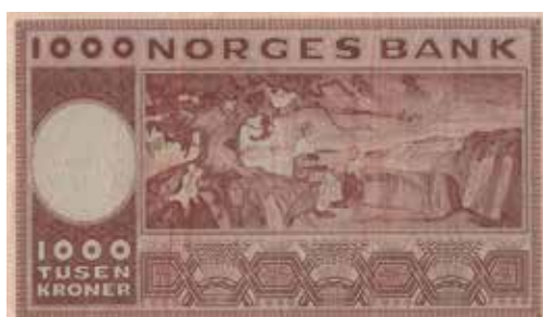
89 1000 kroner 1972 G.2001584 erstatningsseddel. Gradert til 30 VF hos PMG. R-seddel. Kv.1